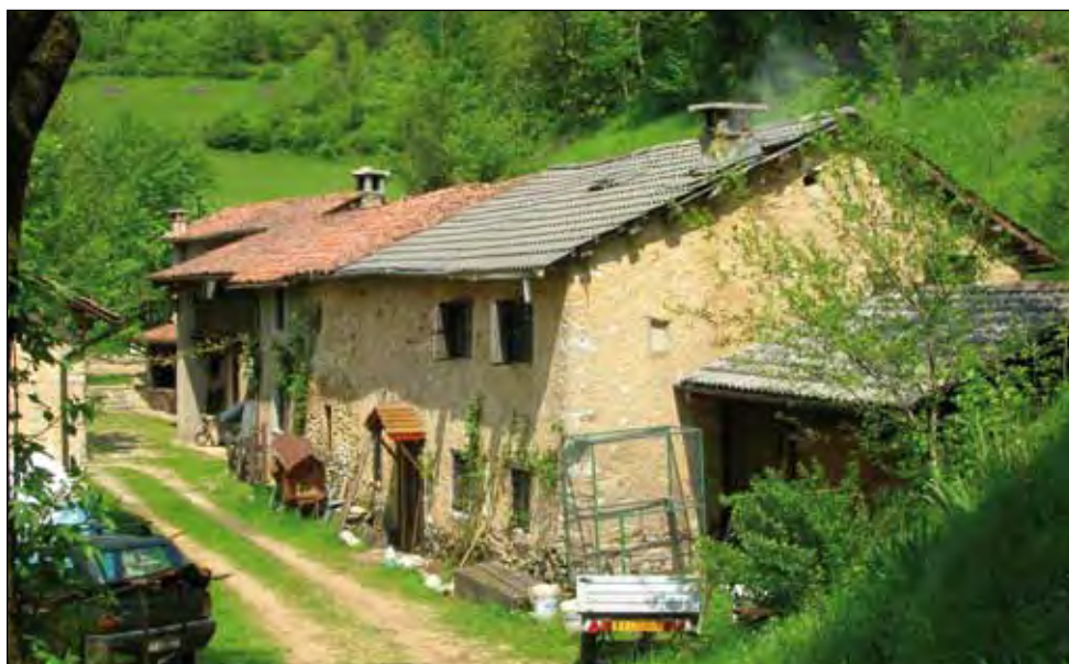
Fig.1 - Località Malga Giochele (Foto P. Storti, maggio 2010)

L'area mineralizzata si trova circa 500 metri a meridione dalla malga stessa, sul lato destro dell'alta valle Mazare ed è stata più volte ricordata in diverse pubblicazioni. In aggiunta alle brevi citazioni in Jervis (1873), Cocco (1966) e Trivelli (1991), descrizioni di carattere prettamente minerario sono riportate da Dal Lago (1899), Casolin (2000), Frizzo e Raccagni (2000); si deve soprattutto a Maddalena (1908) una precisa descrizione della mineralizzazione e delle gallerie minerarie dallo stesso osservate nella zona del Giochele, una delle quali realizzata l'anno prima (1907) della stesura del suo articolo. Il Maddalena afferma che si tratta di una mineralizzazione brecciata, piombo-zincifera, a galena e blenda (sfalerite), con "calamina" e cerussite, posta lungo una faglia al contatto tra il "calcare del Monte Spitz" e quello del