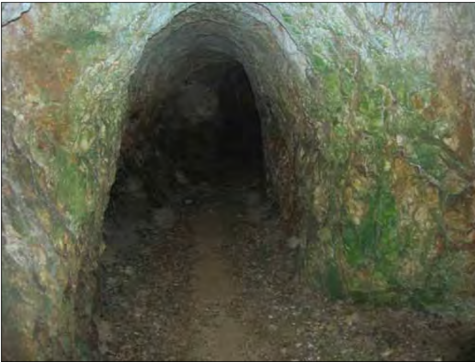
Fig. 2 - Ingresso della galleria M4.

Nel 1907-1908 fu tentata la ripresa dell'attività mineraria da Camillo Dal Lago (Galleria M4, coordinate: 45°40'58"N e 11°14'23"E).